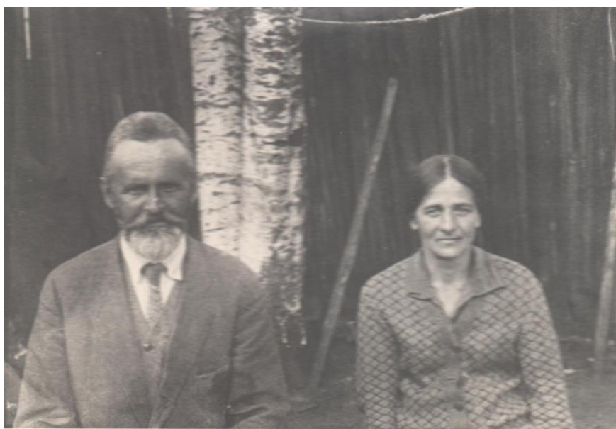
На фото он с женой во время ссылки в Твери в 1928-1935 гг.