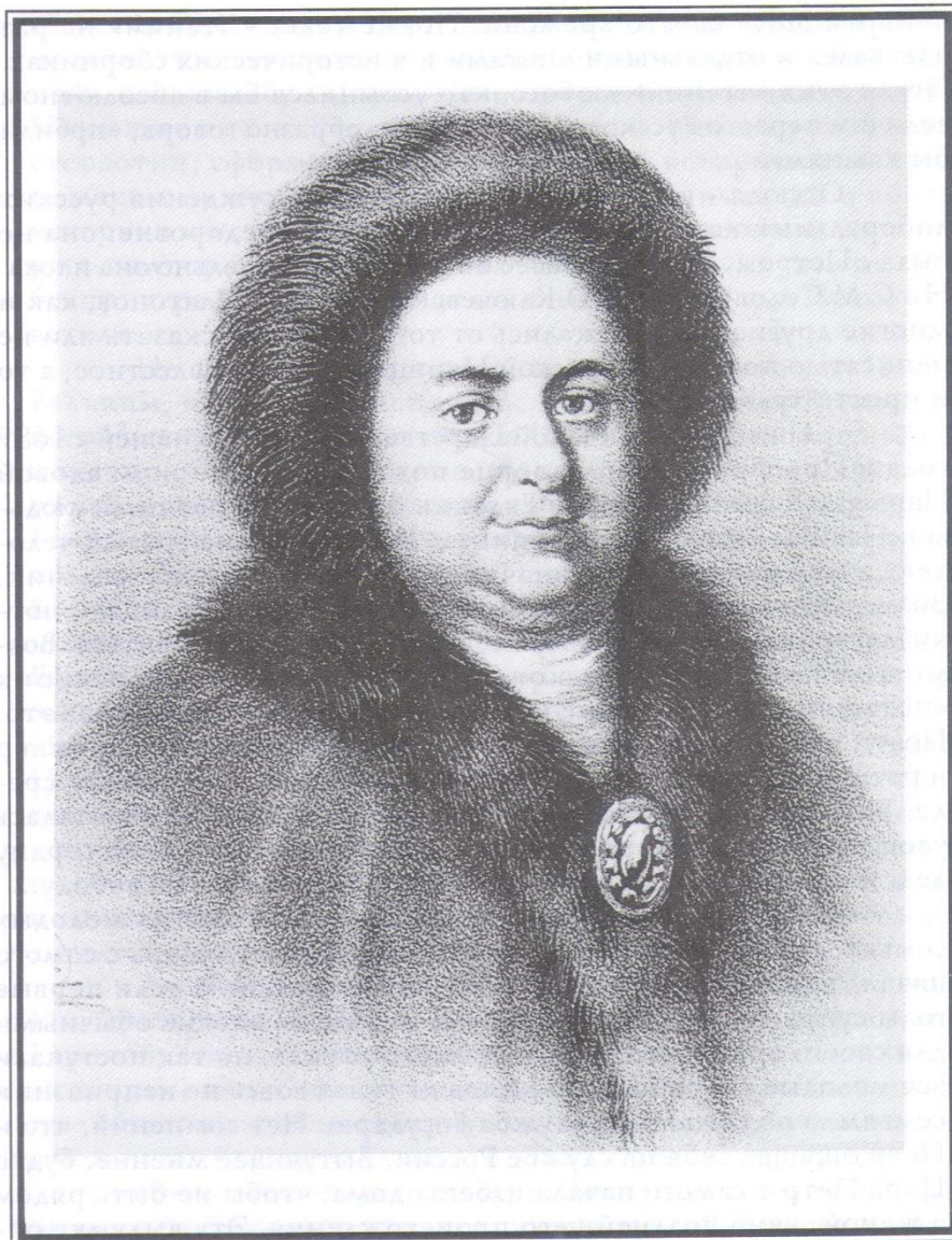
Царица Евдокия Федоровна.